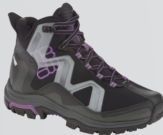
010 Черный, сине-лиловый (новый цвет) (доступно 8/1)