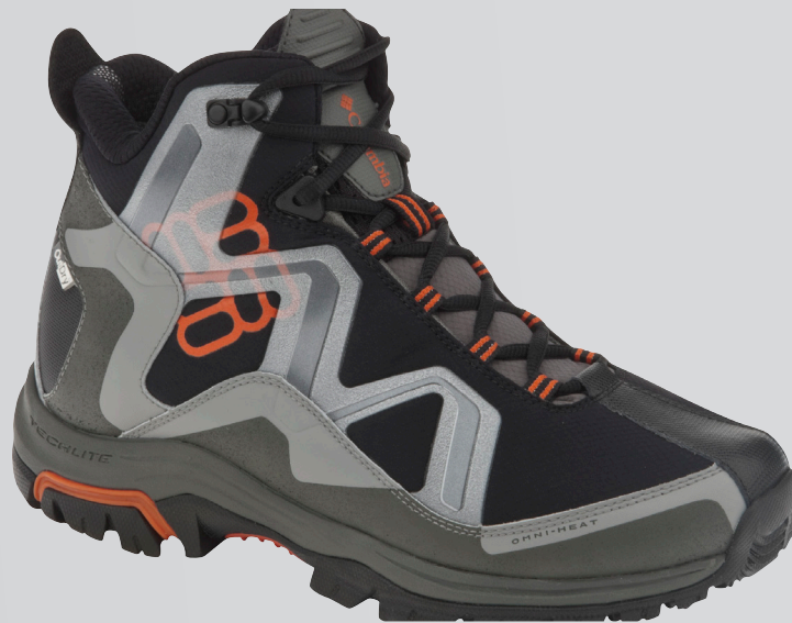
010 Черный, ярко-оранжевый (доступно 9/15)