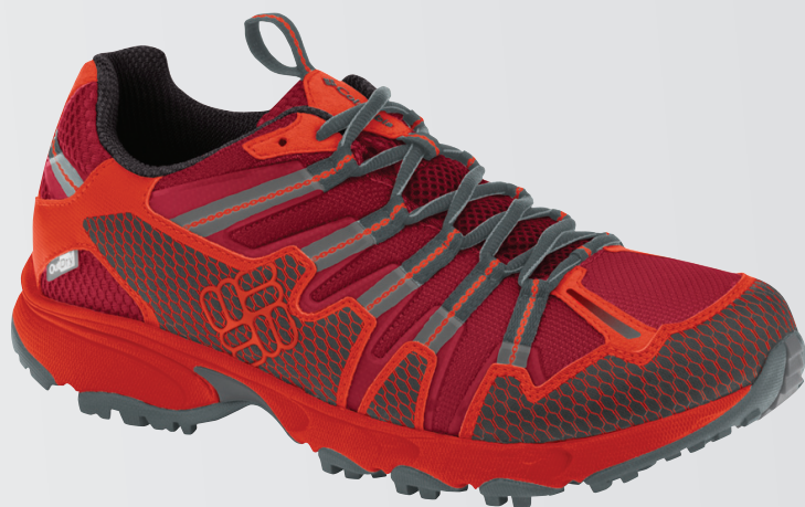
601 Красный, черный (доступно 7/1)