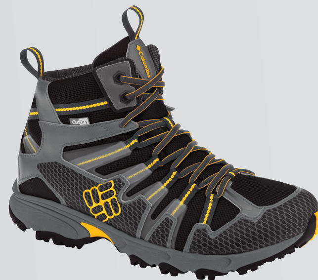
010 Черный, оттенки желтого (доступно 9/15)