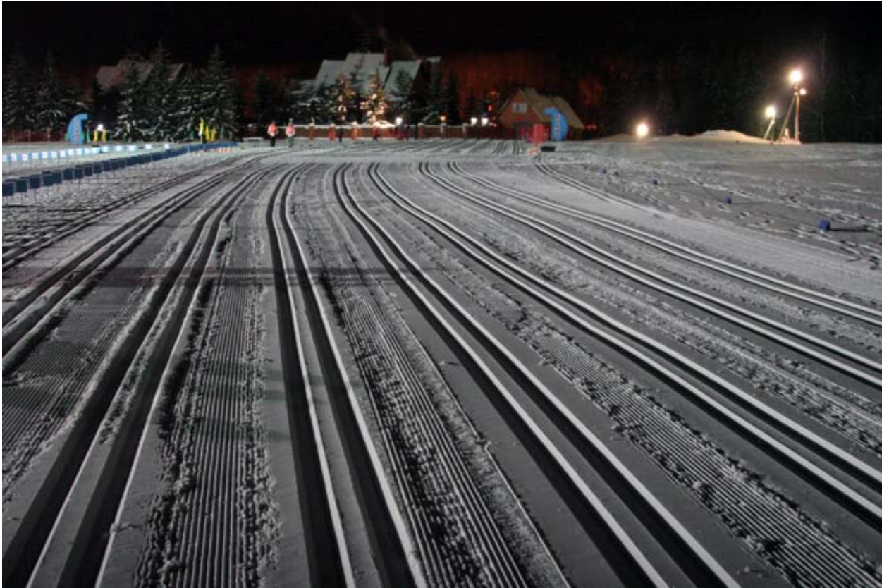
Вид на стартовую поляну стадиона

Начать надо с того, что погода встретила участников довольно серьезным морозом (примерно -15 градусов, правда ветра при этом не было), а организаторы – отлично подготовленной с помощью ретрака трассой с отдельными петлями по 2,5 км на классику и на конек. Весьма серьезный рельеф хорошо освещенной трассы, умеренная дистанция, неплохое скольжение, своеобразный регламент гонки и приличные призовые – все это настраивало спортсменов на нешуточную борьбу, а зрителям, которые во время соревнований постоянно подкреплялись горячим чаем из огромного самовара, обещало красивое зрелище.