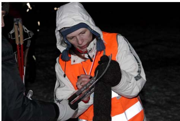
Обязательная маркировка лыж.

- Вечером бегать даже экстравагантней, мне понравилось. Освещения, в принципе, хватало, все видно, так что я считаю, что такие соревнования надо проводить.