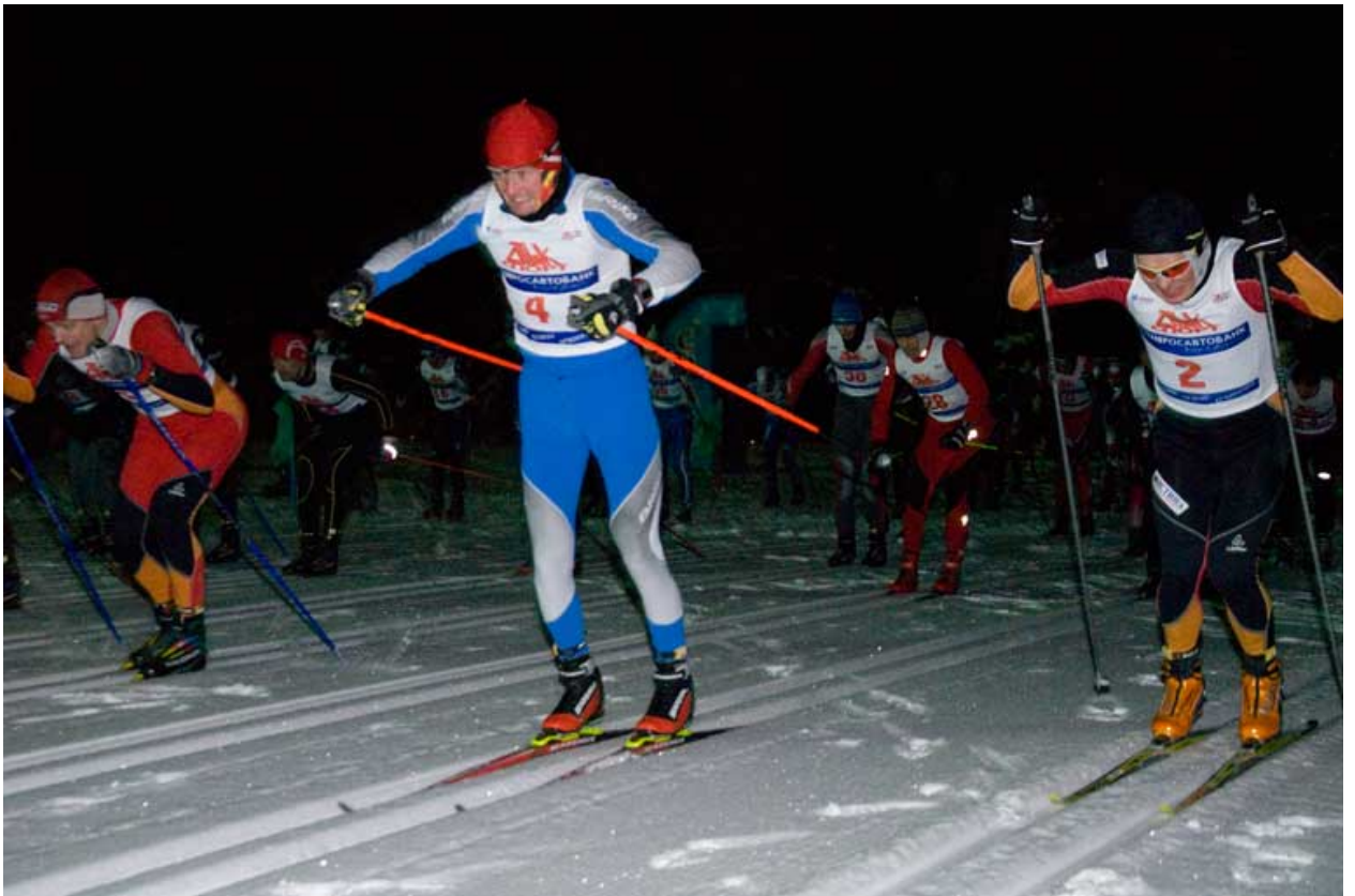
Начало мужской гонки

- Успевали следить по ходу гонки за соперниками? Когда поверили в победу?