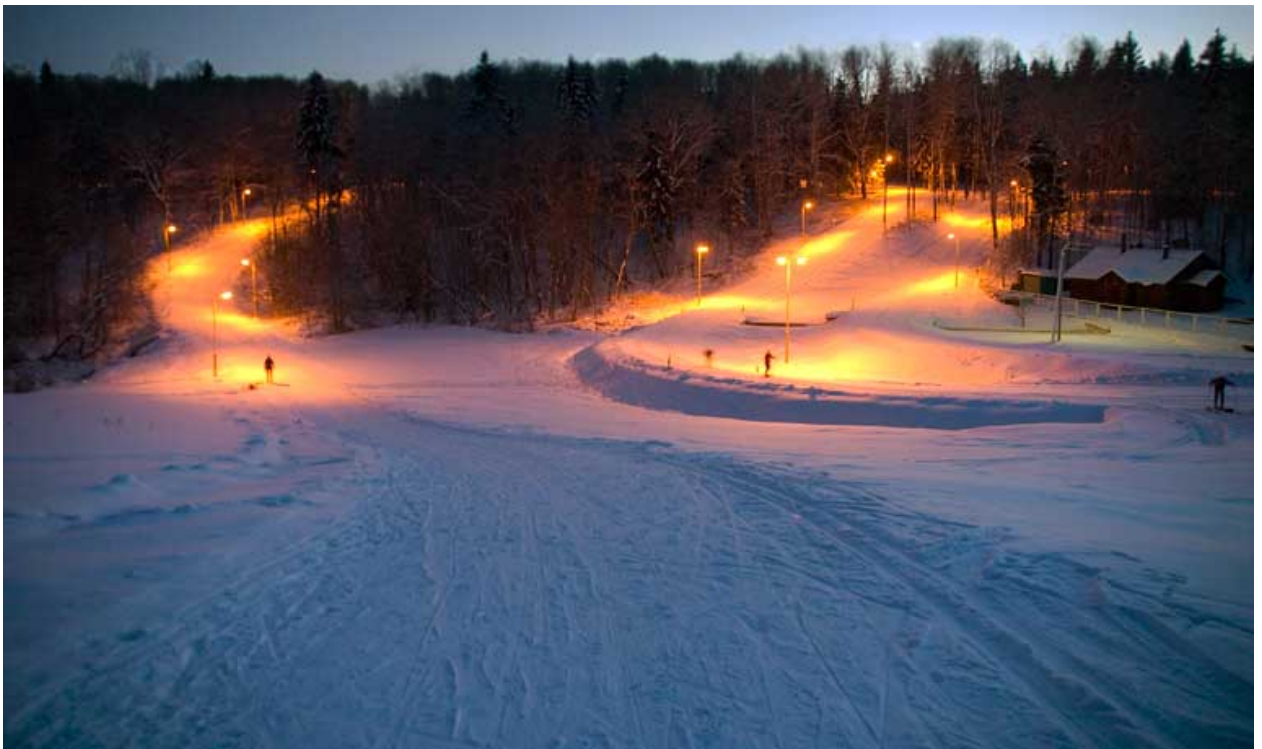
Вид на лыжные трассы: справа – классическая, слева – коньковая.