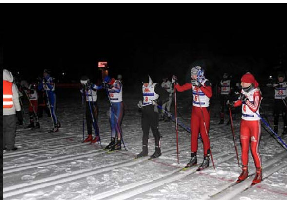
Вечерний старт женской гонки.